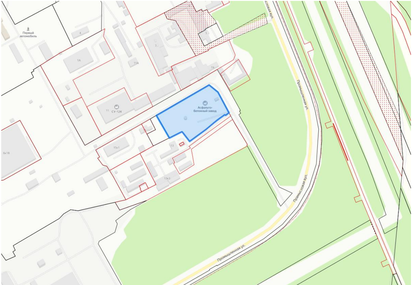
Рисунок 2.2. Расположение земельного участка (данные на основании публичной кадастровой карты и сервиса Яндекс.Карты)