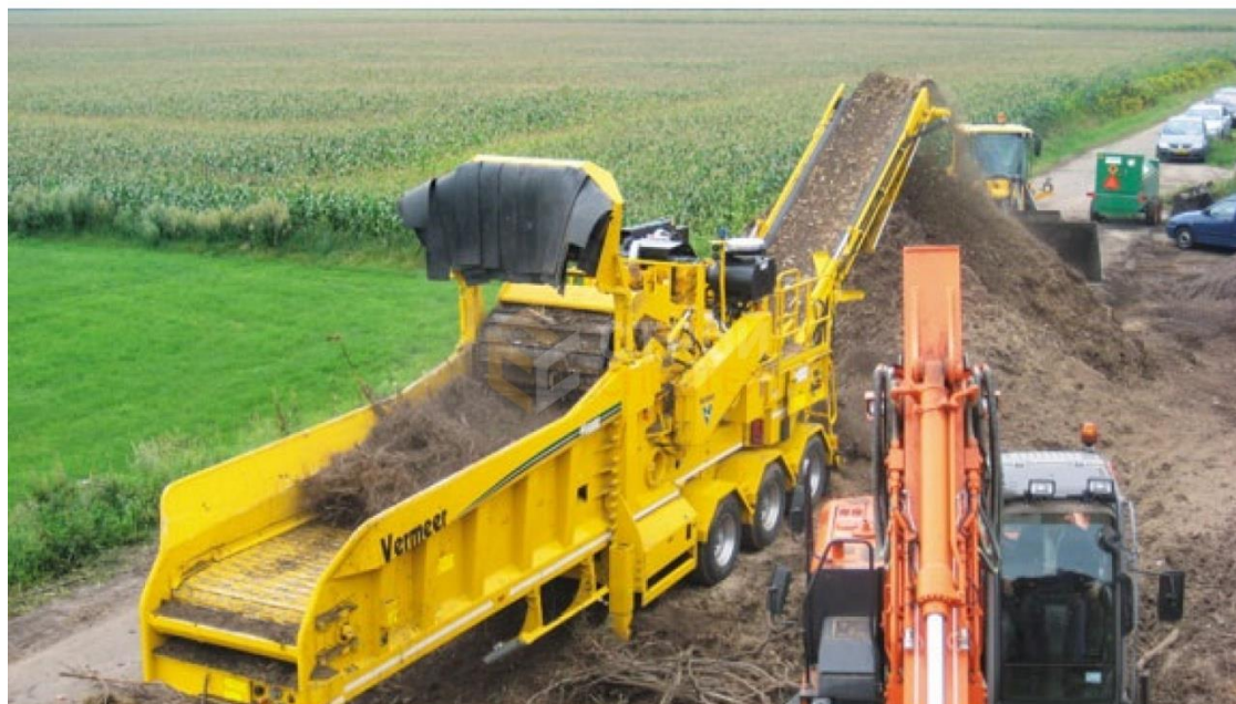
Рисунок 2.4. Внешний вид измельчителя Vermeer HG 6000 TX

Внешний вид измельчителя Vermeer HG 6000 TX представлен на рисунке 2.4.