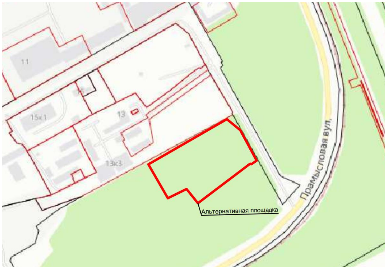
Рисунок 2.3. Расположение альтернативного земельного участка (данные на основании публичной кадастровой карты и сервиса Яндекс.Карты)